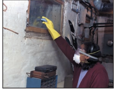
Persona limpiando con respirador N-95, guantes y gafas de protección.