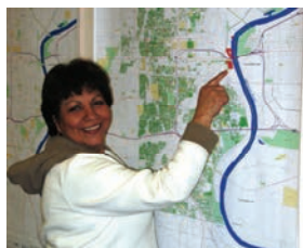
EPA Centro de Información Pública Sucursal Sur