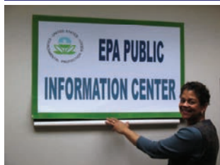
EPA Centro de Información Pública Sucursal Norte