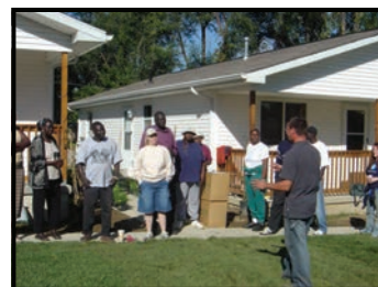
UNL - Extensión Condados de Douglas y Sarpy