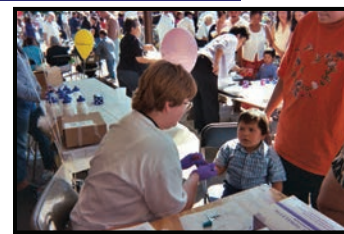
Departamento de Salubridad del Condado de Douglas