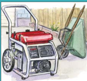
Máy Phát Điện Di Động

Khói hoặc khí độc thải ra từ máy phát điện di động có thể gây tử vong trong vòng vài phút nếu hít phải chúng!