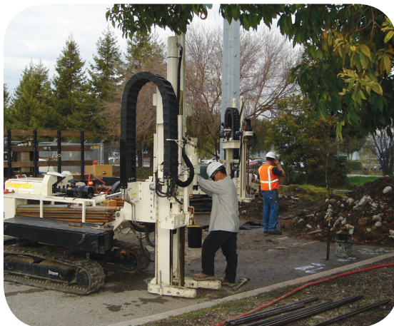
Inyección de aceite vegetal en el subsuelo a fin de mejorar las condiciones para la biorremediación.

Gracias a la biorremediación se han limpiado muchos sitios contaminados y ya se eligió este proceso en más de 100 sitios Superfund de todo el país.