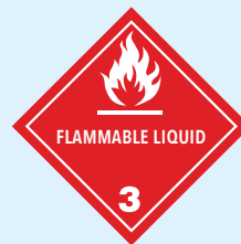
Ignitable Liquid Department of Transportation (DOT) warning label o placard