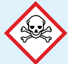
Toxic Substance Occupational Safety and Health Administration pictogram