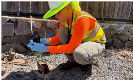
Figure 2. Litratrato ng EPA na kumukuha ng sample ng iniinom na tubig mula sa

Kung natuklasan ang kontaminasyon sa lateral line, ito ay ihihiwalay mula sa water system. Una sa lahat, huhukayin ang area at lilinisin upang makita ang lateral line. Pagkatapos, ang tubo sa punto kung saan nakakabit sa water line ay puputulin at pagkatapos ay tatakpan, upang matiyak na hindi makapasok ang kontaminasyon sa main distribution line. Ang trabahong ito ay makakatulong na mabalik ang ligtas na iniinom na tubig sa Lahaina. Ang EPA ay magkakaroon ng mga lokal na kultural na monitor at archeologist na mag-oobserba sa pagtatrabaho upang matiyak na ang mga sensitibo o makasaysayang lugar ay hindi nagagalaw. Bago gamitin ang inyong iniinom na tubig, tiyakin na magpunta sa Unsafe Water Advisory page ng DWS sa mauirecovers.org/water upang makita kung ang tubig sa inyong area ay ligtas na inumin.