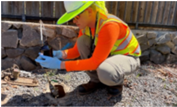
Figura 2: Retrato ti EPA a mangal-ala iti sample ti danum a mainum iti lugar a napuoran iti Lahaina.

Manipud idi tengnga ti Marso, ti EPA ket agsample kadagiti kangrunaan a linya ti serbisio ken dagiti lateral a linya iti uneg ti naapektaran a lugar para kadagiti VOC ken SVOC. Analisaren ti EPA dagiti sample para kadagitoy a kontaminado ken iranudna ti datos iti DWS tapno matulongan ida a mangaramid kadagiti determinasion maipapan kadagiti balakad ti danum ken tapno maikeddeng no sadino ti kasapulan a maisina kadagiti lateral a linya manipud iti sistema ti mainum a danum. Makatulong daytoy a trabaho tapno maisubli ti natalged a danum a mainum idia Lahaina. Sakbay a mausarmo ti danum a mainum, siguraduem a kitaem ti panid ti Balakad iti Di Natalged a Danum ti DWS mauirecovers.org/water tapno maammua no natalged ti danum iti lugarmo nga inumen. Dagiti inaldaw nga update iti panagsample ti danum ti EPA ken nadadael/nakontaminado a lateral a linya a trabaho ket available iti Mapa ti Estoria ti Uram iti Kabakiran ti EPA .