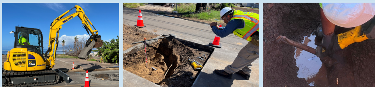
Figura 1: Manipud Kannigid agingga iti Kannawan: Ikkaten dagiti crew ti aspalto babaen ti backhoe; Maysa nga arkeologo ti mangsukimat iti abut; Maysa a crew ti mangputed iti lateral a linya babaen iti ragadi.

Umuna, dalusan ken kalientayo ti lugar iti aglawlaw a kasapulan a maisina ti maysa a lateral a linya. Kalpasanna, maputed ti tubo iti punto ti koneksion iti kangrunaan a danum ket makaluban, a mangsigurado a saan a sumrek ti kontaminasion iti kangrunaan a linya ti distribusyon. Mabalina naringgor daytoy a trabaho. Nasinged ti pannakipagtrabaho ti EPA iti County ti Maui, lokal a monitor ti kultura, ken dagiti arkeologo a sertipikado ti Estado ti Hawai'i tapno, bayat ti panangileppastayo iti trabahotayo tapno masigurado ti kinatalged ti mainum a danum, masalakniban ken maitutop nga maayanantayo met ti aniaman a napateg a banag ti historikal wenno kultural.